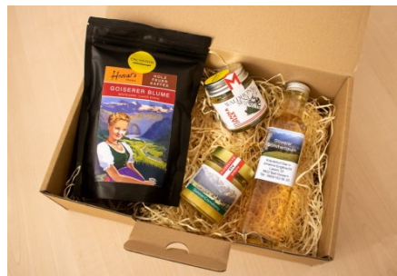
Die feine Genussbox der Ferienregion Dachstein Salzkammergut Der Inhalt kann je nach Saison variieren.